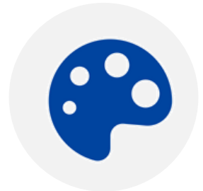
Art & Culture