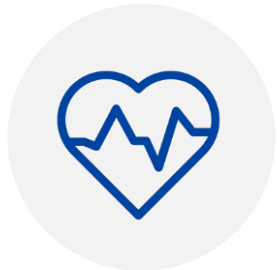
Santé & Confort