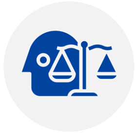
Ethique & Gouvernance