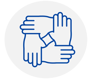
Diversité & Mixité